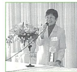
平成15年6月29日の 篁会総会における講演抜粋

たまたま知人が「グループリビング」という活動を始めました。大企業が運営している立派な老人用施設だと入所金が数千万円とかになってしまいますが、そうではなくて、入所金はせいぜい500万円くらいで、毎月の支払いが13万5千円だということです。入所者は10人くらい。ひとり15畳くらいのスペースがあって、共同の車椅子のままお風呂に入れるような施設があり、大きな台所もあり、各部屋にも小さなキッチンがある。ケアマネージャーがちゃんとして、病院とかにも直結している。それもいいなあ、入りたいたいなあというような気持ちで私も勉強させていただいています。月に2回くらいは入所者が集まって、このホームというかグループリビングをどういうふうにしていこうかと話し合い、動かしているんですね。お金を払ってやってもらうのではなく、そこに関わっていこう、面倒なことが起きたら自分たちで解決していこう、自分の老後を自立した、生き生きしたものにして、と。これは特定非営利活動法人の資格をとりました。たったひとつの例ですが、こんなことだって、自分たちの老後を納得いくものにしたいたいような人たちが数名集まって勉強したことから生まれたわけですね。いくつになっても、既存の枠にとらわれず、自分が納得のいく生き方を追求したいものです。