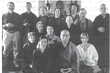
曹洞宗北アメリカ国際布教総監

そういうことを、アメリカの人に言って、人工物質だらけのこの大陸の街へ、少しでも坐禅の大輪が咲くお花畑を耕そうと、蝶のように飛んでいる。夢中説夢の我が生である。そういう日常を可能ならしめるあらゆるものを有難いと思うようになった。