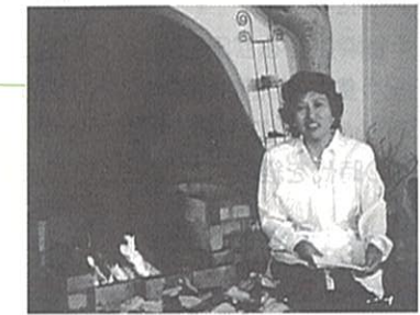
竹早山荘の暖炉の前で