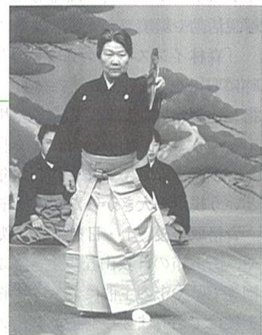
仕舞「難破」平成15年10月25日

歴史に残る熊本判決で国の過ちが断罪されたとはいえ、黒川温泉宿泊拒否事件に見られるように、ハンセン病差別はいまだに根深く残っている。一人でも多くの人にこの本を読んで理解していただき、ハンセン病差別に終止符を、と願っている。